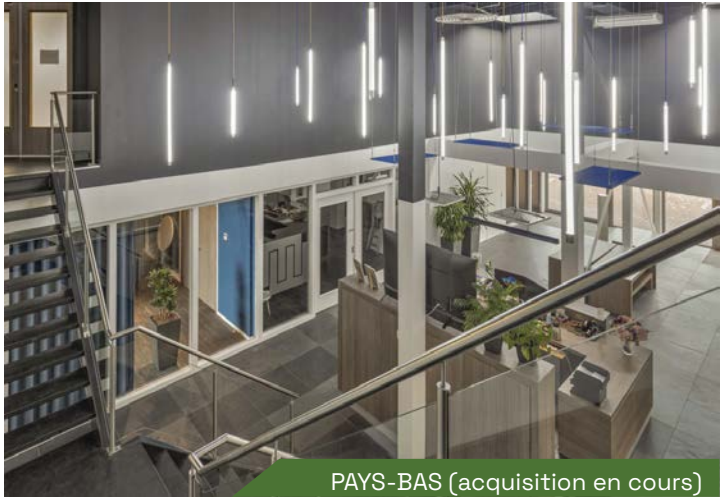
PAYS-BAS (acquisition en cours)